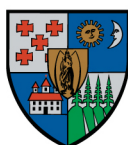
Consiliul Județean Harghita