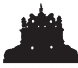
Centrul Cultural și de Arte Lăzarea